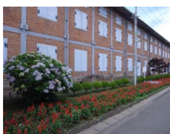
世界遺産登録が近い富岡製糸場。毎日の生活の中にある歴史への誇りがこのまちの底力と実感。