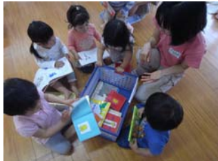
乳幼児も楽しんで育ちます。

家庭館の利用継続を願う市民の声は、アイプラザにはない「板張りの大集会室(体育館)」、「30畳と40畳の和室」、「高齢者に使い勝手の良いピアノ付き集会室」に集中。来年度以降の管理・利用方法のアンケートを7月末まで市が実施。8月中に結果の公表と管理運営を市民協働で取り組むための協議の場の設置を求めます!