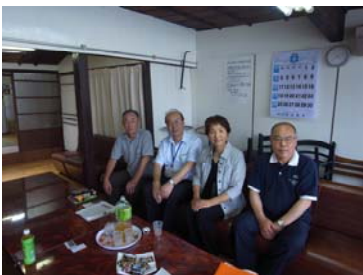
力を寄せ合い区民が自力で作ったご自慢の集会所

豊橋市内の「居場所づくり」の情報を収集し、豊橋のまちに合った居場所を考える。 今後の視察希望・・・静岡県袋井市(「もうひとつの家」と時間通貨「周」) 徳島県藍住町(「幸せの家 ありがとう」)