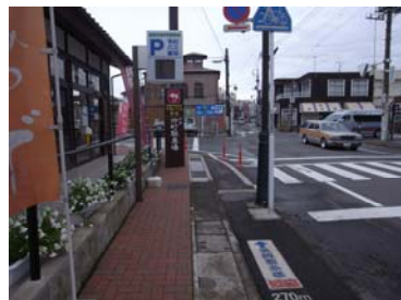
道はすべて「富岡製糸場」へと続く。道路上の案内サインが分かりやすい!